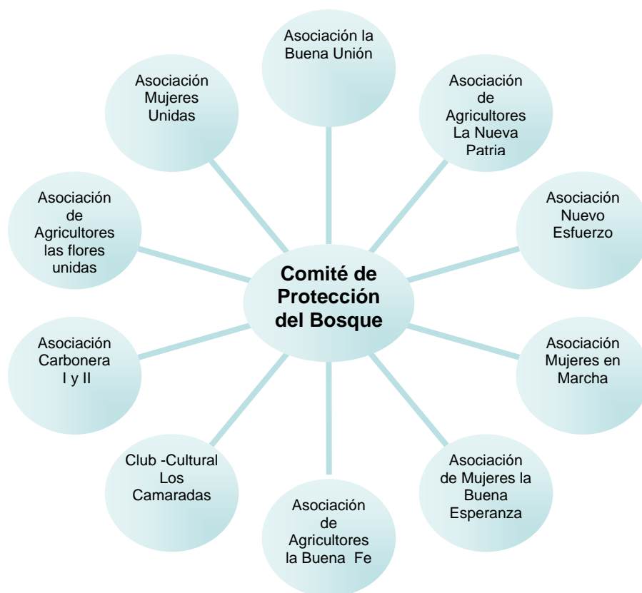
Figura No. 1. Estructura del Comité

Con el apoyo de Lemba, el Comité fue constituido por dos delegados de cada una de las diez organizaciones locales existentes (figura No.1), conformando una especie de junta de organizaciones compuesta por veinte miembros que por consenso designaban entre ellos mismos una estructura directiva formal compuesta de presidente, secretario, tesorero y vocales. Este comité tuvo como misión principal negociar con los trabajadores, intermediarios y las autoridades gubernamentales la adjudicación del Bosque Seco a la comunidad y la implementación de acciones de manejo que garantizaran una mejoría en la calidad de vida de los pobladores.