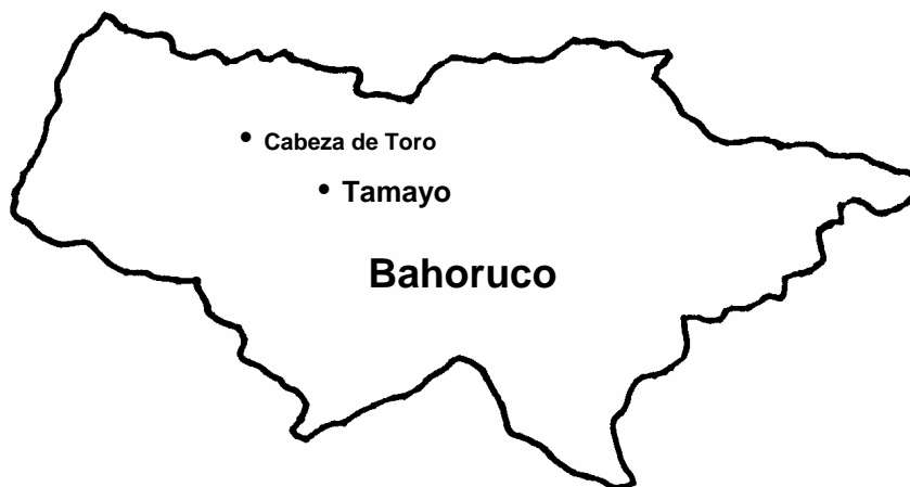
Mapa No. 2. Ubicación de Tamayo y Cabeza de Toro

Con una población de alrededor de 433 familias, las actividades económicas principales son la comercialización de la madera seca proveniente del bosque, la agricultura de subsistencia en tierras de secano y la crianza de animales (chivos y vacas). Cabeza de Toro cuenta con 17 pequeños negocios locales, el comercio de la madera entre intermediarios y comunitarios (en su mayoría mujeres), además de