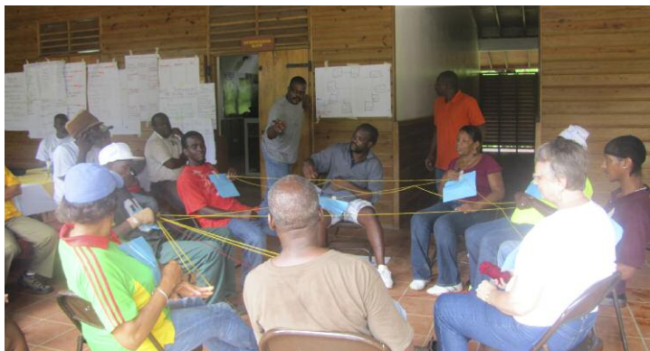
Actores forestales realizan un ejercicio de mapeo institucional en un taller de CANARI

CANARI continúa explorando enfoques nuevos y existentes para adaptarlos a su labor.